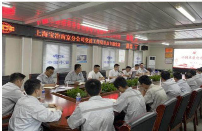
党建联系点讲党课