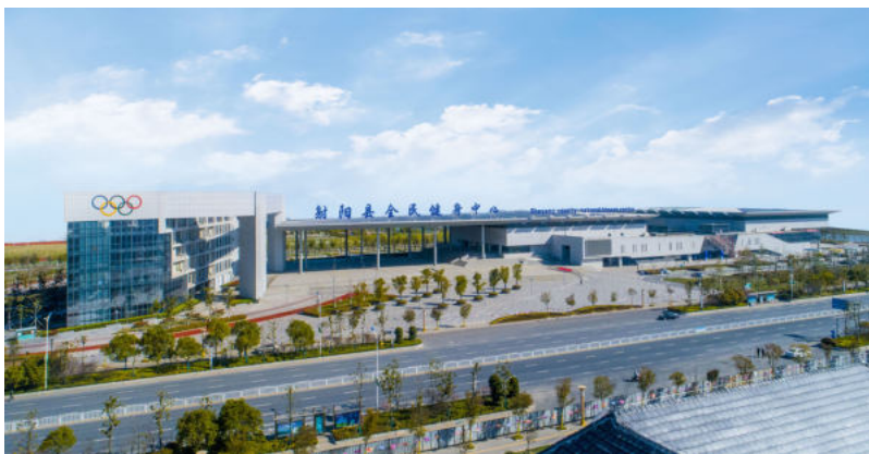
射阳县全民健身中心(扬子杯)

诚行天下，信立伟业。集团坚持将诚信奉为企业发展之魂，像爱护自己的眼睛一样，维护金贸的品牌形象。秉持诚信为本、客户至上的原则，诚信合作，互利共赢，用辛勤的劳动和精准的服务，赢得建设单位和社会各界的认可和尊重。发扬永争第一、追求卓越的传统，锐意进取，永不止步，争夺更多荣誉称号，使金贸品牌不断升值。推进匠心制造、精益建造，在提高成优率的基础上，多创精品工程，为金贸品牌添彩。多年来，在金融行业、社会征信、调查考核和创优夺杯中，金贸建设集团的信誉声望，在盐城建筑行业中一直位居前列，被授予“全国工