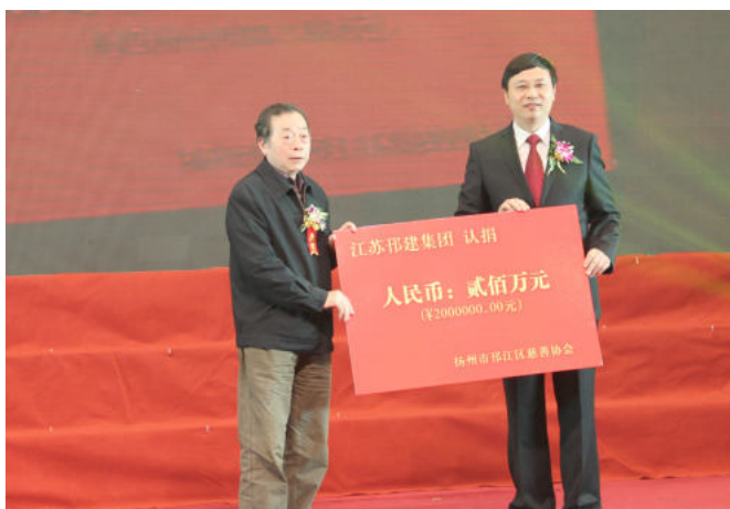
向邗江区慈善总会进行抗疫捐款

江苏邗建集团现有区域分公司23家、专业公司19家，施工队伍分布全国13个省市以及中东部分国家和地区。江苏邗建集团党委是邗江区第一家非公企业党委，现有党员535名，下设24个支部，基本上做到了施工队伍走到哪里，党组织组建到哪里。近年来，集团公司党委坚持“为经济添彩，为党旗增辉”，用习近平新时代中国特色社会主义思想统领党建工作，努力唱响主旋律，打好主动仗，先后获得“全国企业文化建设优秀单位”“全国模范职工之家”“省先进基层党组织”“省企业文化建设成果奖”“省文明单位”“省五一劳动奖状”“市非公企业示范党组织”等一系列荣誉称号。