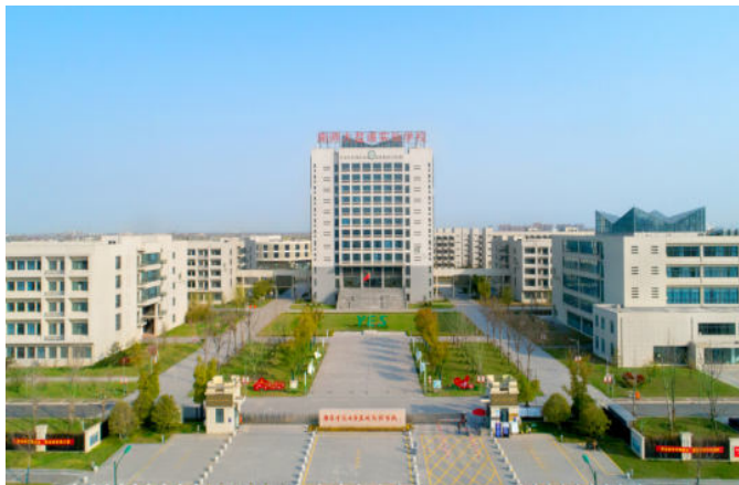
南京师范大学盐城实验学校(扬子杯)

程建设诚信典型企业”“全国信用评价AAA级信用企业”“全国建筑施工信用6星企业”。博得广大客户和社会各界的普遍赞誉。为彰显企业综合实力和品牌形象，在盐城高新区投资20多亿元，开发建设总面积达33万 m^2 ，集总部经济、科研办公、金融服务、商务酒店于一体的科技广场中央商务区项目已经开工，建成后将成为盐城大市区西部标志性建筑群和重要的商贸中心。