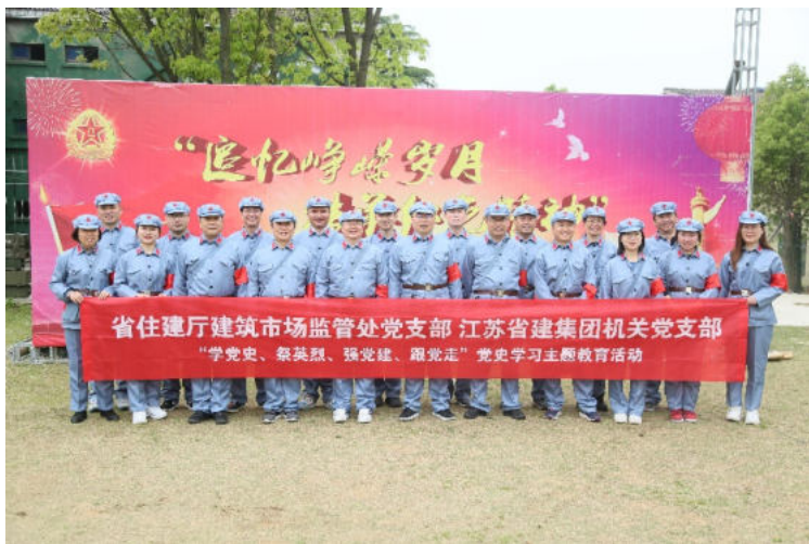
与省住建厅建筑市场监管处党支部开展党建共建活动

（一）拓展了党建项目创建思路，服务中心的理念更加明确。 以基层工作为抓手落实机关党建项目创建，找准党建工作和业务工作的契合点，将两者有机融合起来，突破了传统意义上的党建工作思路，克服了就党建抓党建“封闭式”思维，拓宽了党建工作视野，扩大了党建工作的覆盖面，拓展了党建工作的平台，促进党建工作更好地服务中心