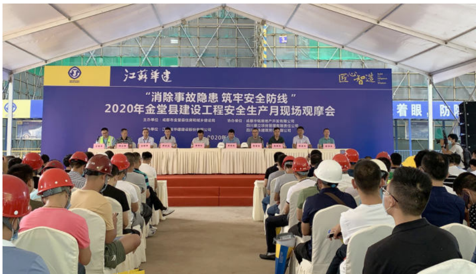
金堂县建设工程“安全生产月”现场观摩会

线意识，以高度的政治自觉把安全生产工作做实做细做好，坚决遏制各类重特大事故。公司以国务院、省、市安委会巡察整改意见为鉴，举一反三，警钟长鸣，紧盯施工安全、消防安全、餐饮等重点行业领域，从严从实开展安全生产专项整治行动，坚决杜绝走过场，对查出存在隐患的下属企业，落实限期整改措施，督促其抓紧整改，确保查到位、改到位。