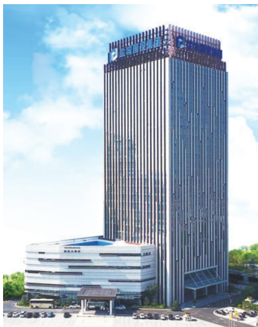
盐城国投嘉园酒店写字楼(国优)

雄关漫道真如铁，而今迈步从头越。新时期、新愿景、新挑战，时不我待，捷者先登。金贸将认真学习同行标杆企业先进经验，紧扣发展目标，求真务实，克难求进，甩开膀子加油干，努力实现建筑业更高质量的发展。