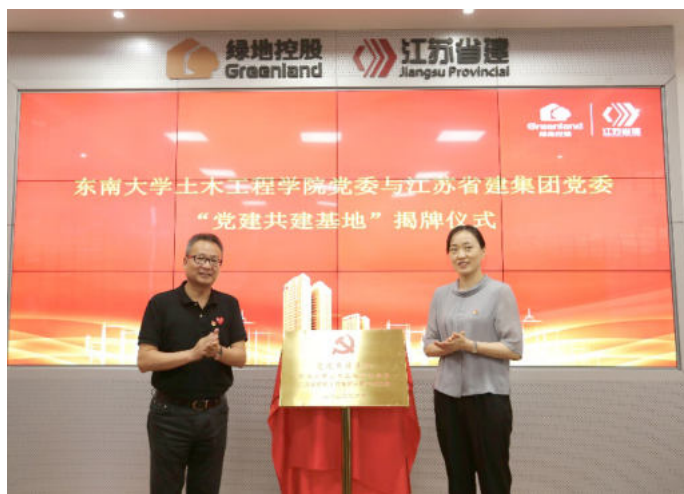
与东南大学土木工程学院开展党建共建活动

（一）坚持围绕主营业务，做好“选题”，寻求党建切入点。 开展机关党建项目创建，选准、立好项目是关键。如何让党建项目创建“选题”既有党性高度，又能切实服务基层、服务群众，“坚持围绕基层业务工作，寻求党建切入点”是关键。在近几年的党建品牌项目选择中，我们不断总结经验，结合集团五大板块业务发展需求，坚持问题导向，让项目创建能以重点业务工作为核心内容，以基层党员队伍为核心