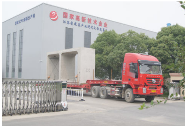
江苏省建筑产业现代化示范基地

长期以来，金贸人视工程质量为生命，传承鲁班文化，弘扬工匠精神，每接一个建设项目，都创一处文明工地，造一座优质工程，赢一片赞誉之声。创建了一批省、市级优质工程，盐城国投嘉园写字楼工程