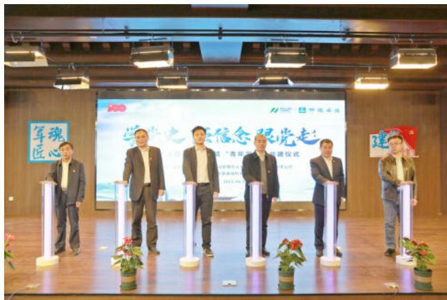
江苏省首个“青年学堂”启动仪式

2021年，中建安装南京公司各项重点项目全力冲刺，加速推进。江苏省首个装配式桥梁工程项目312国道改扩建项目正在冲刺通车节点、首个以中建安装名义承接的市政路桥项目盐城市东亭路改造项目已进入验收、首个超高层建筑改造项目新华大厦楼宇及附属设施运营管理服务项目完成施工前期准备、首个医疗卫生工程总承包项目江北公共卫生服务中心快马加鞭做好开工准备、首个机场航站楼工程总承包项目涟水机场项目已竣工投用、江北新区创新高地重点项目国际健康城二期已顺利封顶；桥林水厂、句容水