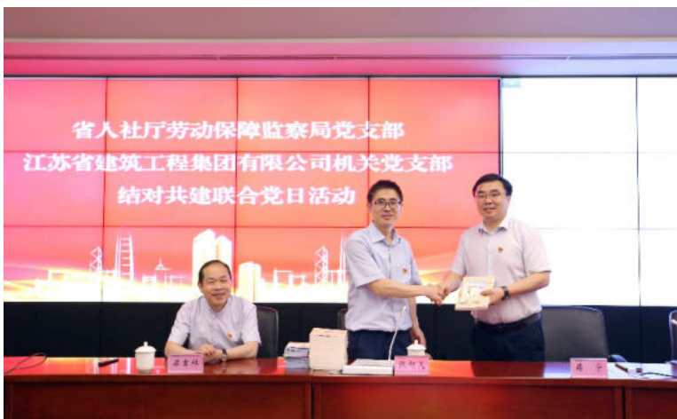
与省人社厅劳动保障监察局党支部开展党建共建活动

同时，为进一步巩固党建项目创建的良好成果，一方面，夯实制度基础。坚持党建工作和业务工作一起谋划、一起部署、一起落实、一起检查，需要建立健全相关制度和机制。江苏省建制定了专门的党建共建制度，规范了党建共建方案、流程、协议书等关键