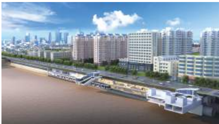
南京地铁9号线一期工程项目效果图

三是践行竞争差异化战略。 致力实现“品牌影响力强”。以公司重点产品为立足点,打造王牌基础设施业务,聚焦高端机电安装、装饰业务,关注设计咨询业务;着力打造机场航站楼、城市综合体、医疗卫生、整体校区、环保水务、城市更新品牌产品。