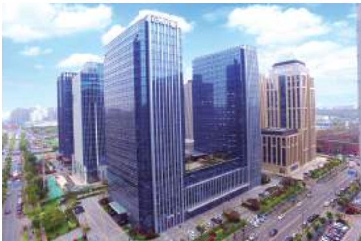
南京正太中心(全国建设工程项目施工安全生产标准化工地)

建筑企业具有人员流动性大、立体交叉作业多，外部环境影响变化大等特点，因此必须做好安全教育工作。秉持“敬业、善学”的企业精