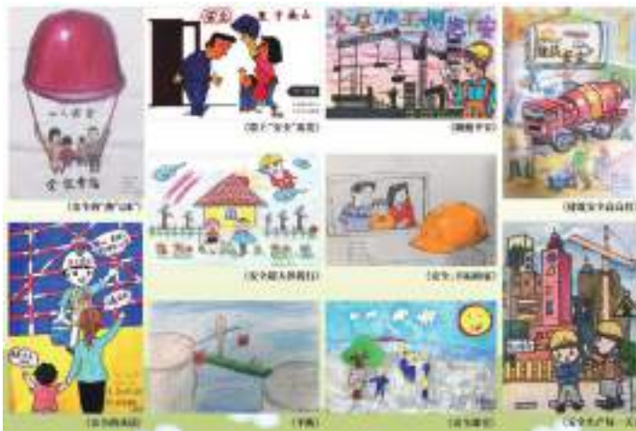
构筑安全文化:安全漫画大赛

安全工作,责任重大,使命光荣。安全工作只有进行时,没有完成时,落实企业安全生产主体责任,推动公司高质量安全发展,苏中建设一直在路上!