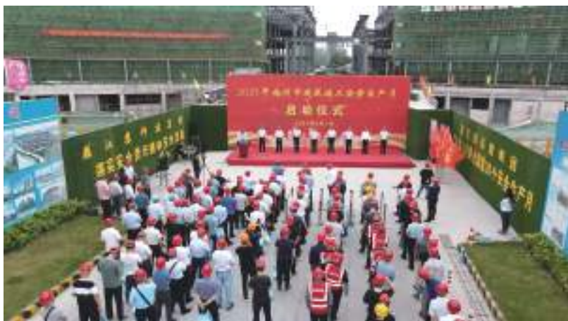
2021年扬州市建筑施工安全生产月启动仪式在集团公司承建的扬州颐和医疗健康中心项目举行

强化安全生产基础管理。 集团公司根据国家、省、市安全文明施工标准化施工的规范要求,制定了《江苏邗建集团安全管理标准化图册》,指导项目标准化管理,所有安全防护定型化、工具化。把好