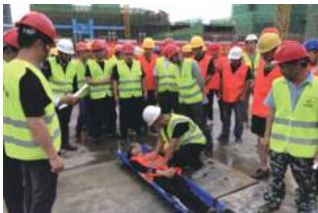
现场安全应急演练活动

今年是建党100周年,做好安全生产工作尤为重要。安全生产是人命关天的大事,是构建和谐企业的前提。通过各项活动开展,为江苏省建集团安全生产