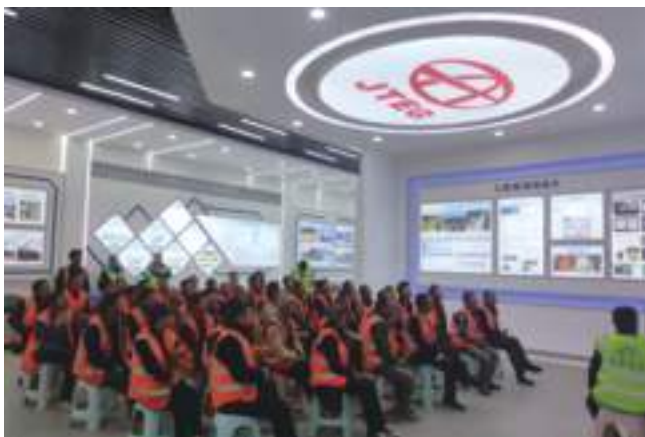
组织工人进行安全教育

由集团工程管理部牵头,完成了《远程监控系统、无线单兵系统应用管理办法》《施工现场进门刷卡、工资入卡及统一着装管理办法》《施工现场车辆使用安全管理规定》《在建工程“红黄蓝绿”挂牌管理规定(试行)》《关于进一步强化项目人员实名制管理,加大民工工资支付力度的通知》《关于切实加强施工现场超龄等人员管控的通知》《关于建立健全项目部安全生产管理机构,强化项目日常安全管理行为的通知》《安全生产工作奖惩办法》等相关文件,同时加强对上述文件规定落实情况的抽查工作。