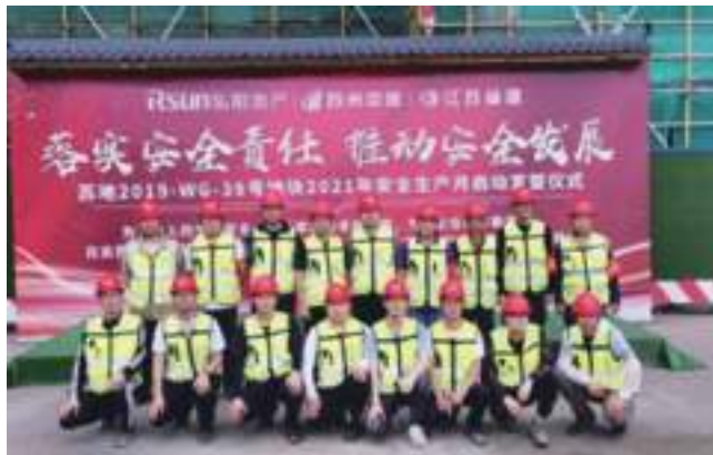
“安全生产月”活动宣誓