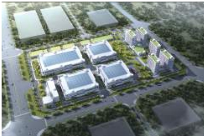
明光市电子产业园建设项目效果图

国家、区域发展重大战略,精准对接地方发展需求,优化市场布局,把握发展机遇,扩大经营规模,在服务国家战略、推动区域发展中实现企业更大发展。