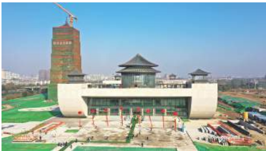
扬州中国大运河博物馆安全生产现场观摩会