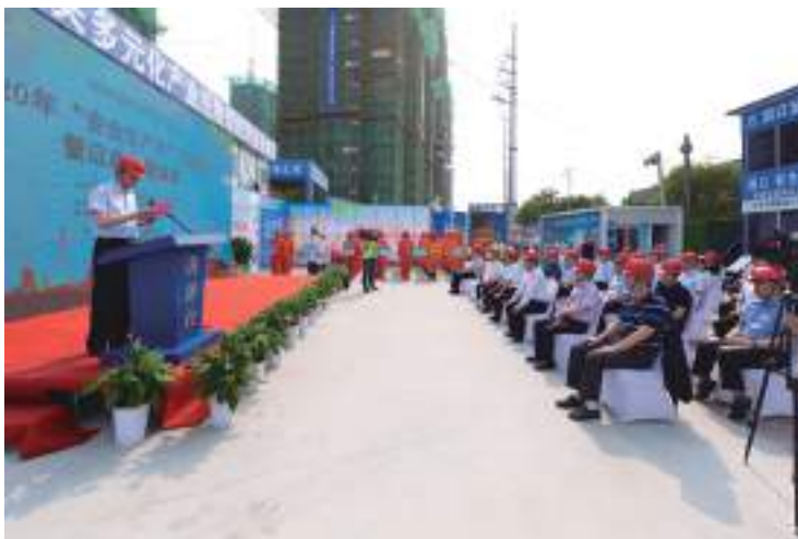
安全生产月启动会

公司强化组织领导,推动专题学习。各区域公司、工程公司、项目部成立“安全生产月”活动领导小组,主要负责人亲自布置、落实“安全生产月”系列活动。各单位组织深入学习《生命重于泰山》电视专题片,强化红线意识以及责任落实,推动全体职工以“生命至上、