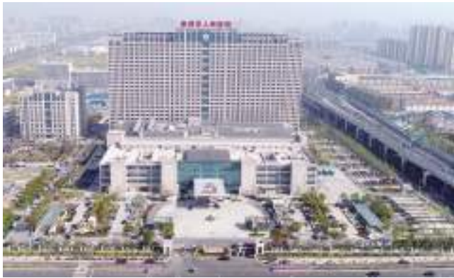
泰州市人民医院新区医院(国优,全国AAA级安全文明标准化工地)

管理、分级管理、封闭管理的方式,加强过程控制并按照PCDA循环方法,注重抓源头、抓基础、抓落实,制定相关的标准和实施方法,确保项目建设在工期、安全、成本、创优、环保等各个环节处于可控状态。