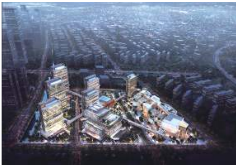
阿里巴巴江苏总部项目效果图