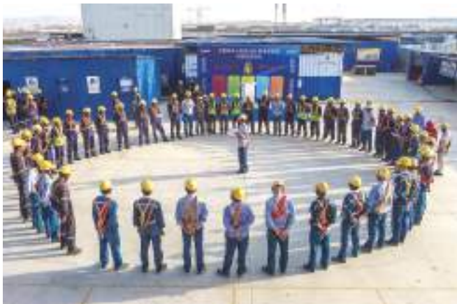
海外华龙一号项目班前会讲安全

多次修订公司评价标准和实施标准,夯实基础管理,做到全面精准达标,持续改进提升。2013年底,公司首次取得军工企业标准化一级达标企业,多年来持续保持。公司始终做好班组安全建设工作,开展作业人员“安全行为之星”和“平安班组”评选活动,通过采