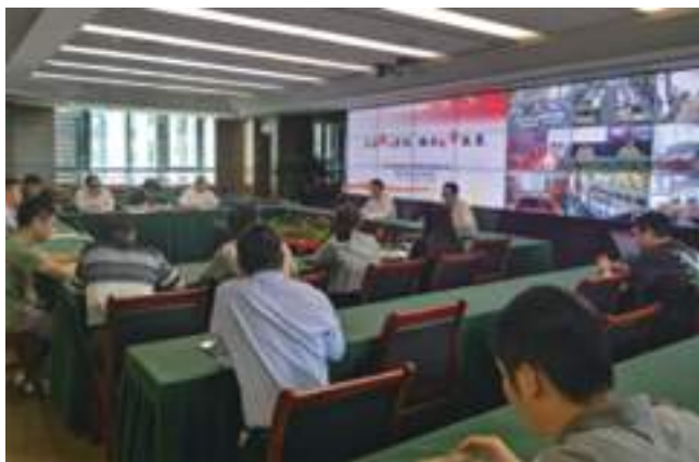
集团召开“安全生产月”启动动员会

在重视日常安全教育、培训、演练的基础上,努力创新安全管理的工作方法,通过开展安全调研、组织安全竞赛、场区内布置安全宣传橱窗等一系列生动、有趣的方式,将安全知识和理念潜移默化地传递给员工。通过“安全知识宣传周”、“事故警示教育周”、“互检互查周”、“隐患排查整改周”“生产月总结”等行之有效的