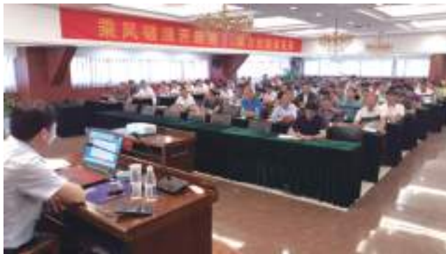
开展安全教育培训

事故的发生是安全隐患积累的必然结果,任何事故都有一个从产生隐患、酝酿发展到偶然触发的过程。