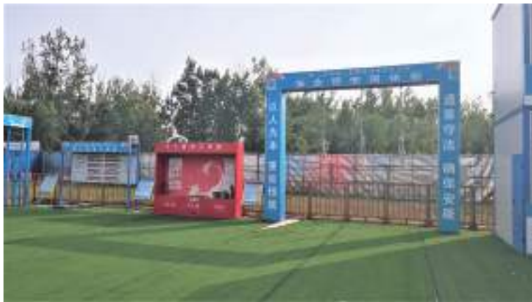
芙蓉华轩安全体验区

抓检查,专项整治根除隐患。 多年来,公司形成了一整套成熟型的安全生产管理常态化运行模式,致力于对安全隐患“零容忍”。今年初,集团、地区公司组织对在建项目进行开复工检查、通报、整改和“回头看”,对新开工项目实施安全交底,督促项目部做好“三级”安全教育,集团、地区公司不定期对项目部进行动态检查,将安全受控目标作为重中之重。年中,集团、地区公司分别组织规律性的两次综合大检查、“六查六比”活动,在项目一线形成了巨大的推动力。并以月度“安全底线和红线管理”“安全设备条线规定动作”的OA平台上报制度,邀请第三方专业单位对大中型机械进行把脉问诊、深耕安全痛点,为推动“安全生产月”开