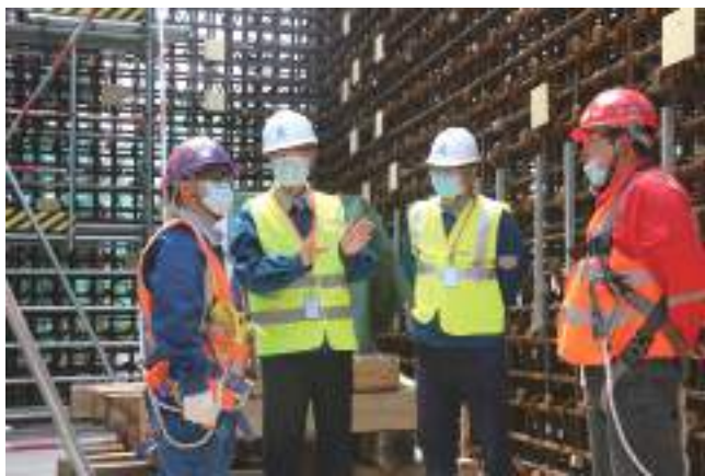
开展安全质量环保领导带班检查

中核华兴分层级落实安全教育培训。每季度发布培训教材,组织全员学习安全环保知识;每年制定应急演练计划,开展应急管理专项培训;全面梳理存在的职业健康风险,建立和动态更新公司《职业危害因素辨识清单》;通过入场培训、专项培训、班前会、安全技术交底、安全体验区和VR体验等方式落实对作业人员的安全教育培训。仅2020年,各级单位共计开展各类安全教育培训5397场次,92018人次接受培训;开展应急