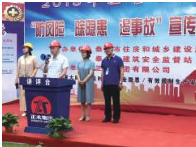
市级安全文明施工现场观摩活动 在泰州恒大华府2.2期项目举行

在安全标准化管理过程中,公司一方面侧重于生产现场的标准化,主要包括办公区、生活区及施工现场扬尘措施及各种加工棚的防护产品标准化的实施,规范现场管理,特别是安全文明标识标牌的设置等;二是侧重于过程控制标准化,在施工过程中按照公司目标