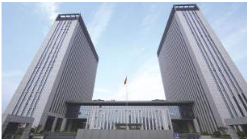
翔宇大厦工程(鲁班奖)

效甚微。面对重重压力,项目部另辟蹊径、大胆创新,在既要保证工期,又要确保工程质量高标准的前提下,再次组织专业人员多次进行实地考察、反复测量,根据地勘报告、监测记录等相关资料从多角度进行专业的评估后,提出了管井加轻型井点的复合降水方案。最终,功夫不负有心人,在项目部的充分调研和专业数据支撑下,以及和专家的反复沟通认证下,最终,一致通过专家评审,该方案有效解决了雨水沉积的问题,大大加快了施工进度。据