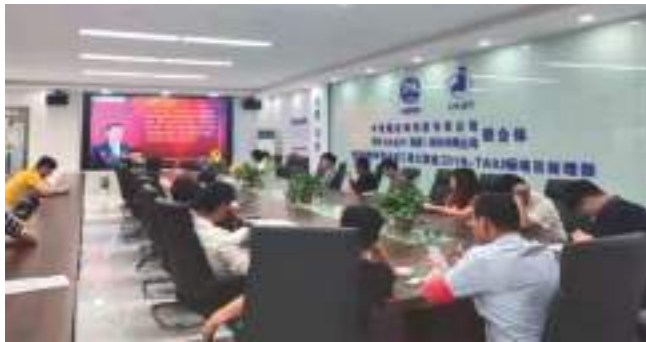
观看安全教育视频

发展是第一要务,安全是第一保障。“祸患常积于忽微。”海恩法则告诉我们,每一起严重事故的背后,必然有29次轻微事故和300起未遂先兆以及1000起事故隐患。